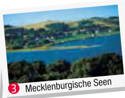
3 Mecklenburgische Seen