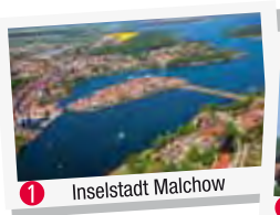
1 Inselstadt Malchow

Literatur Tipp: Radeln in der Mecklenburgischen Seenplatte, Seestern Verlag www.seestern-verlag.de