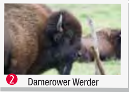
2 Damerower Werder