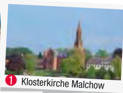
1 Klosterkirche Malchow