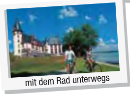
mit dem Rad unterwegs

Eine Übersichtskarte mit den hier aufgeführten Sehenswürdigkeiten finden Sie auf der Rückseite.